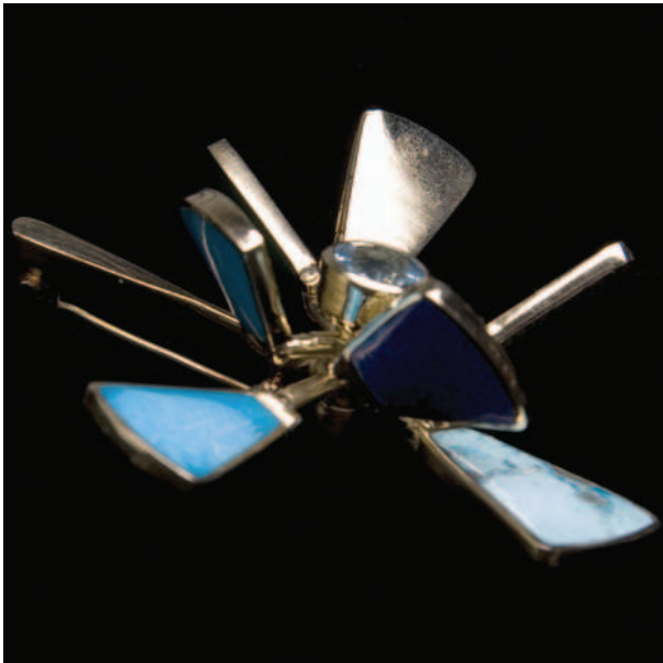
Silvano Zanchi scultura semovente, 2007 oro cesellato, acquamarina, lapislazzulo, turchese diametro 6